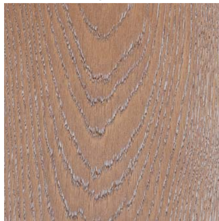
Südbrock Holzfußleiste: 22.40.21 Eiche elfenbein, 20 x 40 mm, 250 cm