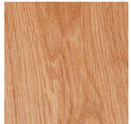
1-Stab Landhausdiele 524091 Eiche Sierra V2 BioTop Öl

Südbrock Holzfußleisten: 22.40.1 Eiche, 20 x 40 mm, 250 cm 22.60.1 Eiche, 20 x 60 mm, 250 cm