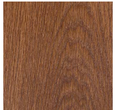
Südbrock Holzfußleiste: 22.40.20 Eiche sierra Braun, 20 x 40 mm, 250 cm