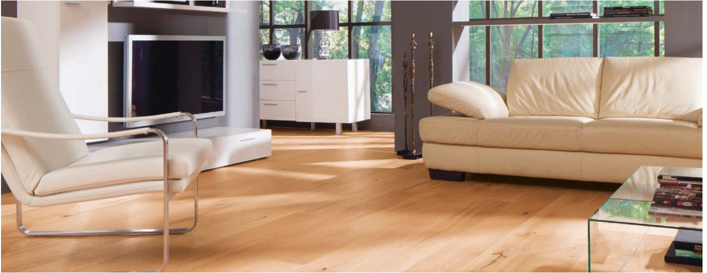
1-Stab Landhausdiele 524090 Eiche Classic V2 BioTop Öl