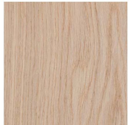
Südbrock Holzfußleisten: 16.40.36 Eiche weiß, 16 x 40 mm, 250 cm 16.61.36 Eiche weiß, 16 x 60 mm, 250 cm