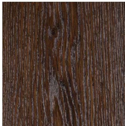
Südbrock Holzfußleisten: 16.40.22 Räuchereiche, 16 x 40 mm, 250 cm 16.61.22 Räuchereiche, 16 x 60 mm, 250 cm