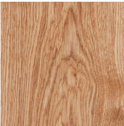
Südbrock Holzfußleisten: 22.40.1 Eiche, 20 x 40 mm, 250 cm 22.60.1 Eiche, 20 x 60 mm, 250 cm