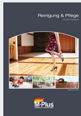
Dr. Schutz Pflegeset Für geölte Holz- und Korkböden