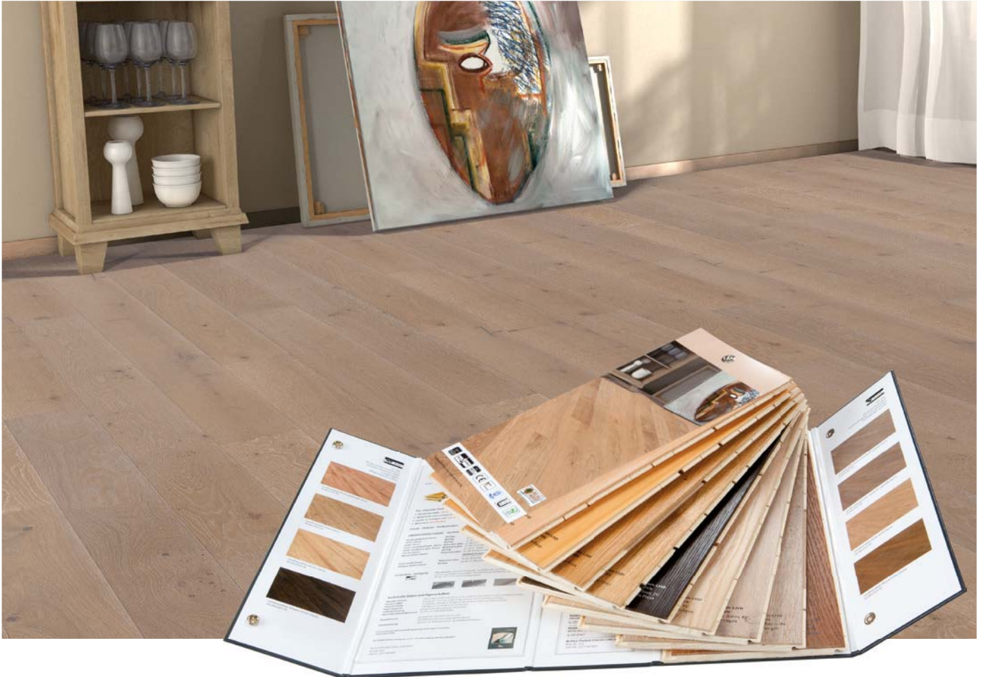
1-Stab Landhausdiele 524093 Buche ged. Sierra V2 BioTop Öl