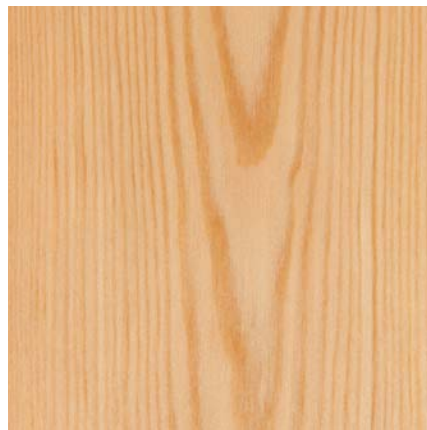
1-Stab Landhausdiele 524092 Lärche Classic V2 BioTop Öl

Südbrock Holzfußleisten: 22.40.3 Kiefer, 20 x 40 mm, 250 cm 22.60.3 Kiefer, 20 x 60 mm, 250 cm