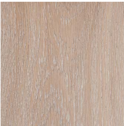
Südbrock Holzfußleiste: 22.40.22 Eiche silbergrau, 20 x 40 mm, 250 cm